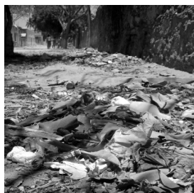
Algures na Ilha de Moçambique

as más condições de conservação destes. Além disso os próprios vendedores são os principais responsáveis desta situação que nos é agravante e que põe em risco a saúde pública. Exemplificando, os vendedores de manga e de banana. Depois de tanto vender os seus produtos, vão-se embora sem primeiro limpar o lixo que é deixado pelos seus clientes e no dia seguinte voltam a vender no mesmo local sujo, criando mosquitos e outros insectos. Isto é o que se considera má higiene .